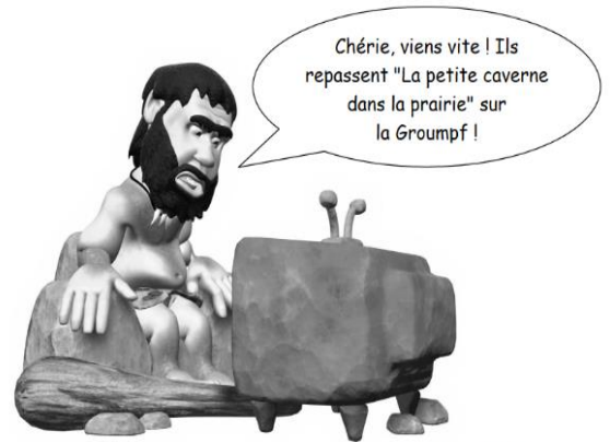
IREM de REIMS